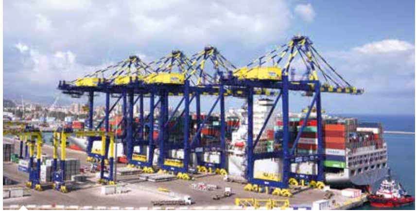
Akdeniz'in en doğusunda bulunan İskenderun Limanı Türkiye'nin yanı sıra Orta Doğu ülkelerinin ürünlerinin dünya pazarlarına ulaştırılmasında önemli rol oynuyor.

Hatay'ın ihracatında ana pazarları Avrupa Birliği ve Orta Doğu ülkeleri oluşturuyor. Bu şehrin 2019 yılında en fazla ihracat gerçekleştirdiği ülkelerin başında 226,4 milyon dolar ile İtalya, 201,7 milyon dolar ile Irak, 187 milyon dolar ile İspanya,