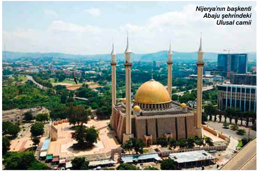
Nijerya'nın başkenti Abaju şehrindeki Ulusal camii

Nijerya, Türkiye'nin Afrika kıtasındaki 6'ncı, Sahra Altı Afrika'da ise Güney Afrika Cumhuriyeti'nden sonra 2'nci büyük ticaret ortağı konumunda bulunuyor. Türkiye-Nijerya arasındaki ilişkiler, 1982 yılında Nijerya'nın eski başkenti Lagos'ta imzalanan ticaret anlaşmasına dayanıyor. Dönemin ihtiyaçları ve şartlarına göre imzalanan bu anlaşma Türkiye'nin Nijerya'dan kakao, kola cevizi ile meyvesi, kauçuk, palm cevizi, kalay cevheri ile metali, çinko, ham petrol ve kömür gibi ürünler ithal etmesini, Nijerya'ya ise gıda ürünlerinden inşaat malzemelerine, elektronik ürünlerinden tarım aletlerine kadar farklı ürünler ihraç etmesini kapsıyor.