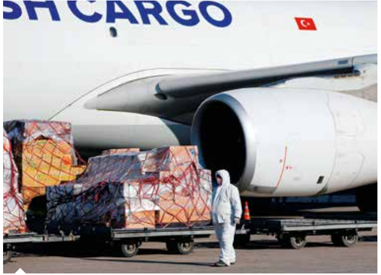
Tarımsal ürünlerin pandemi dönemindeki ihracatında hava kargo öne çıktı.

D ünya ekonomisi Covid-19 salgını nedeniyle tarihte benzeri görülmemiş bir krizin eşğine gelirken sıkıntılı süreç her alanda olduğu gibi küresel tarım sektörü açısından da önemli sonuçlar doğurdu. Son yıllarda ülkeler için sanayi ve dijital sektörler öncelikli alanlar olarak öne çıksa da Covid-19 salgını tarım ve hayvancılığın ekonomiler için ne derece kritik olduğunu bir kez daha ortaya koydu. Ülkeler için ürünlerin sağlıklı, ucuz ve güvenilir olmasının yanında bunun sürdürülebilir, verimli ve sürekli kılınması temel hedef oldu. Koronavirüs salgını sürecinde tohum bankaları, verimli tarım uygulamaları, tarım alanlarının korunması ve genişletilmesi ile israfın önüne geçilmesi gibi konular ulusların en öncelikli gündem maddelerini oluşturdu.