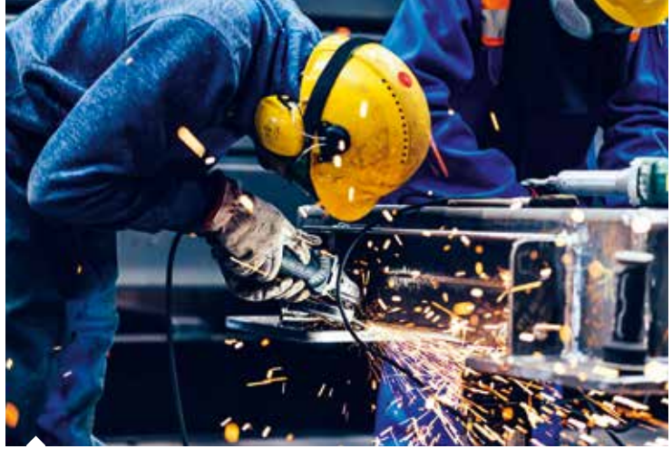
İSO İkinci 500'de teknoloji yoğunluklu sanayilerin toplam içindeki payı arttı.