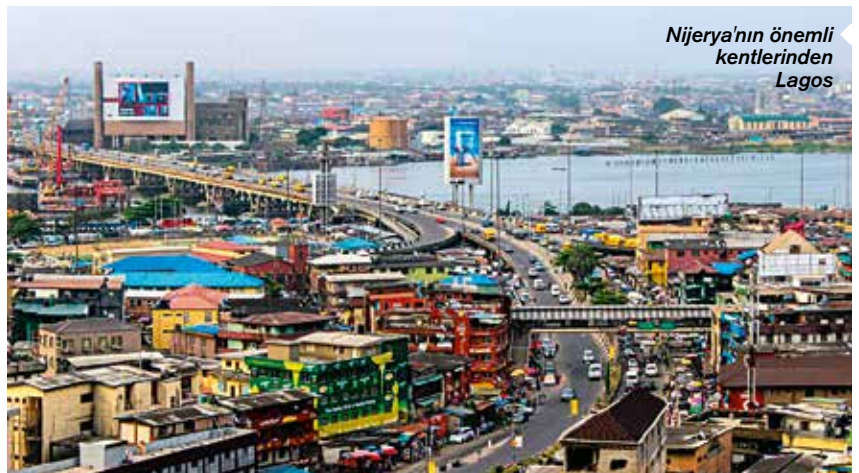
Nijerya'nın önemli kentlerinden Lagos